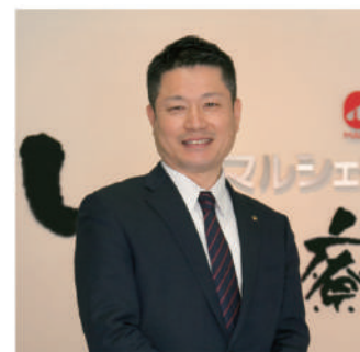
2022年12月吉日 代表取締役

このような状況ではありますが、餃子食堂マルケンの発展、八剣伝ブランド再構築を促進し、しっかりと未来を見据えた業態展開を推進してまいります。